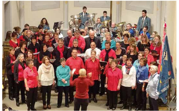
Concert de Noël du 12 décembre à l'église du Bouveret. Le chœur St-Michel, le chœur des Moins Jeunes et l'Echo du Grammont interprètent ensemble l'Hallelujah de Leonard Cohen.

Arrivée au terme de ce jubilé, je tiens à remercier les grands, les petits, les enfants, les mamans, les papas, les musiciens, les directeurs, les chanteurs et toutes celles et